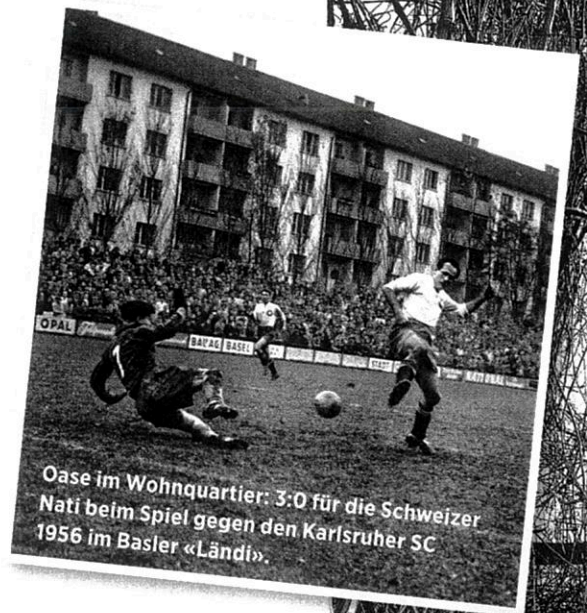
Oase im Wohnquartier: 3:0 für die Schweizer Nati beim Spiel gegen den Karlsruher SC 1956 im Basler «Ländli».

Werner Skrentny: «Es war einmal ein Stadion... Verschwundene Kultstätten des Fussballs»; Verlag Die Werkstatt, 2015, 176 Seiten, Fr. 34.90