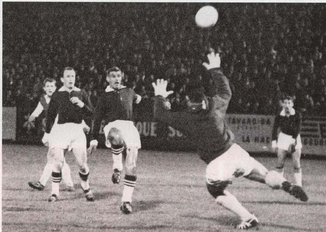
Mai 1962: Servette sorgt vor dem GC-Tor für Unruhe. In diesem Jahr gewannen die Genfer einen ihrer 17 Meistertitel.

Aber Servette überlebte und nahm 1899 den Spielbetrieb wieder auf. Doch weil Servette damals Rugby spielte und die übrigen Genfer Klubs sich dem Schweizerischen Fussball-Verband angeschlossen hatten,