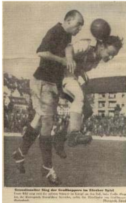
Trello contre son ancien club GC lors de son ultime saison à Genève