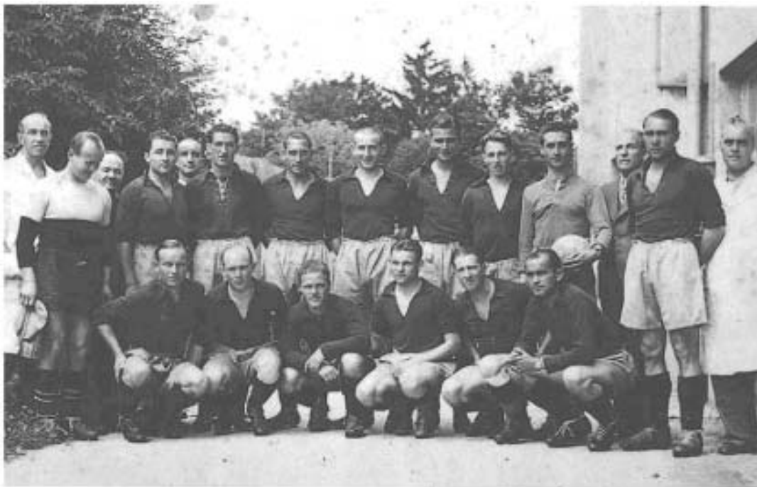
Les champions de 1939-1940 !